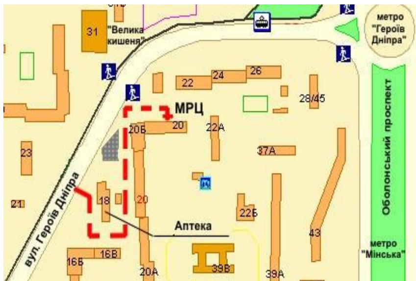
Схема проїзду до МРЦ автомобілем